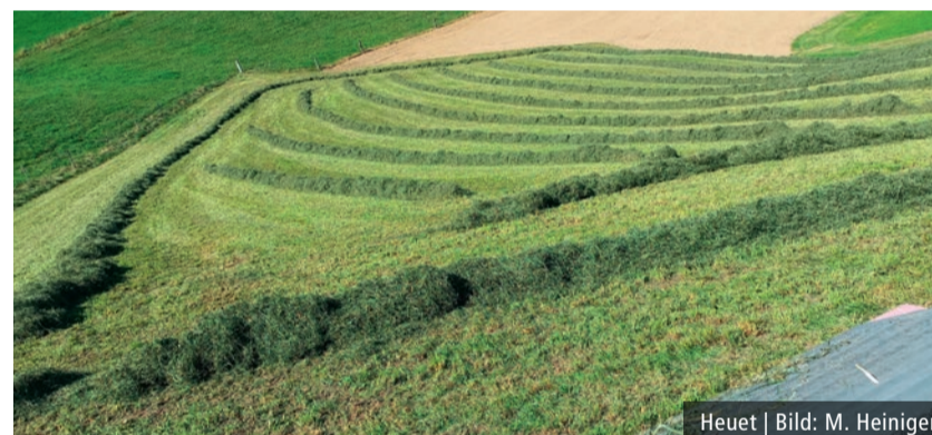
Heuet