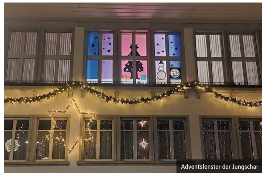
Adventsfenster der Jungschar

Die Pfarrpersonen erzählten eine oder zwei Geschichten, in die man eintauchen konnte, dazu konnten die Anwesenden die Klänge der Kirchenmusikerinnen geniessen.