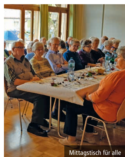
Mittagstisch für alle

rob.kaeser@gmx.net brigitte.siegenthaler@gmail.com