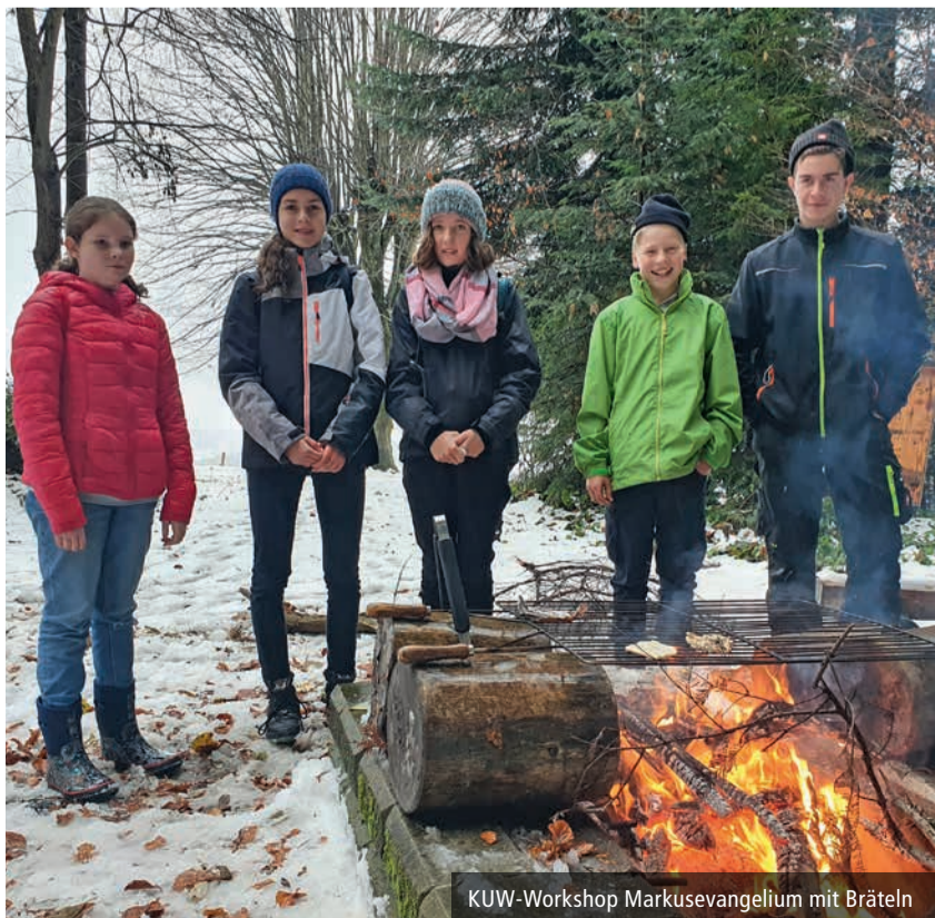
KUW-Workshop Markusevangelium mit Bräteln

«Gott spricht: Siehe, in die Hände habe ich dich gezeichnet.» Jesaja 49,16